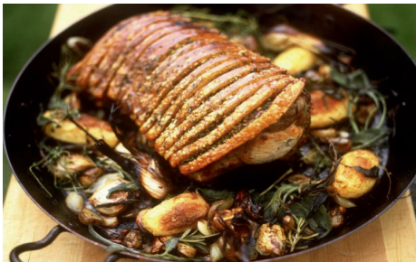
»Feistes, knusperiges Schwein« mit Erdäpfeln