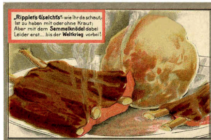
»Ein Knödel, aus Semmeln gut und fein!«