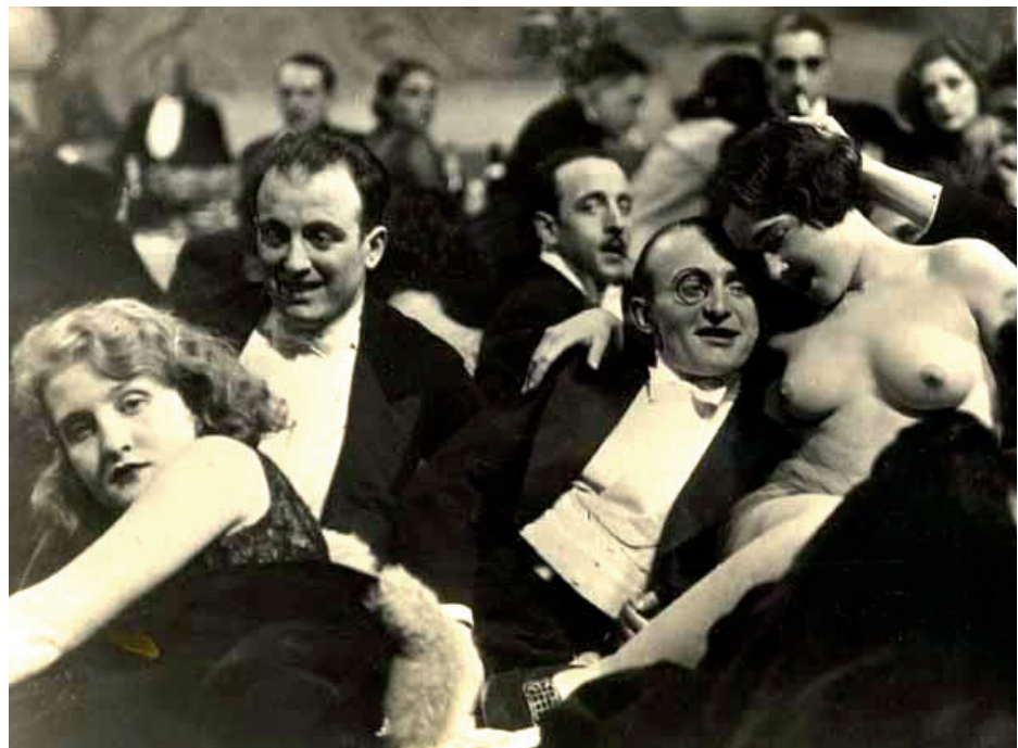
Nachtlokal. »Jeder Besucher wird zugeben müssen, daß die Bezeichnung »42 Mörser-Programm« auf dem Plakat nicht zu viel versprochen hat.«

Ich versteh dich nicht, da bin ich ganz anders. Von mir kommt keiner zur Konschtatierung. Ausnahmen kann man ja machen. Aber im allgemeinen, das is doch einmal ein Gefühl, das man hat, wenn man die Burschen so vor sich zittern sieht. Wie einer anfängt zu zittern, ruf ich schon »Tauglich!« Da kann er Gift drauf nehmen.