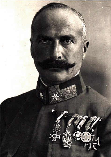
Kollege des Regimentsarztes: »Was is das einzelne Menschenleben wert?«