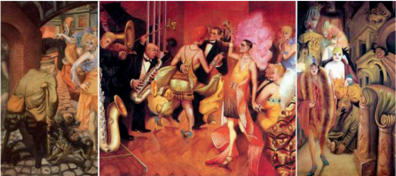
Otto Dix: Metropolis

Stegreifdichter Rolf Rolf, Sängerin Frieda Morelli, eine Stimme, ungarischer Viehhändler, Besitzer des Nachtlokals, Getreidehändler Kammerrat Knöpfelmacher, Stammgast, betrunkenen Funktionär des Roten Kreuzes und sein Kollege, zwei Offiziere, Regimentsarzt und sein Kollege, Rufer und Gegenrufer, ein Rufer und seine Antwort, Betrunkenener, Gelächter und Rufe, zwei eintretende Offiziere, Gäste, Animiermädchen, Garderobepersonal, Toilettefrau, Offiziere, Buffetdamen, Lebemänner, Herren vom Roten Kreuz, polnische Legionäre, Personal, Mitwirkende, die Salonkapelle Nechwatal, die Zigeunerkapelle Miskolczy Jancsi