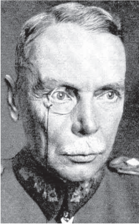
Regimentsarzt: »Man muß den Weibern imponieren.«