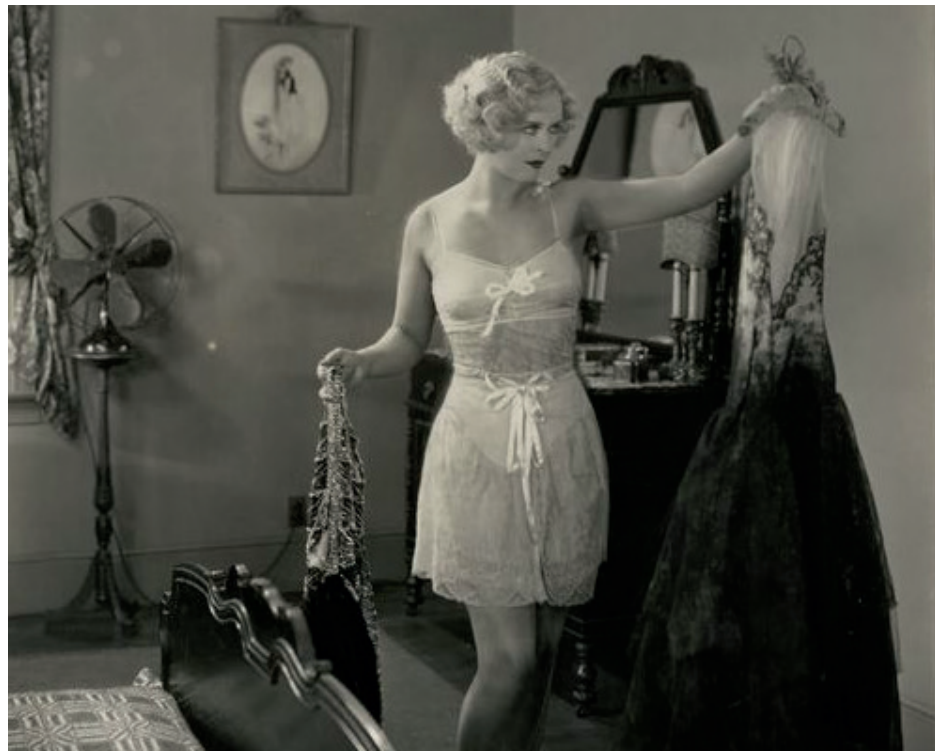
»Wissen Sie – ich als Frau hab ja auch gar nicht mal so den rechten – Überblick, nich wahr?«