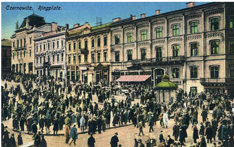
Czernowitz, Hauptstadt des österreichischen Kronlandes Bukowina