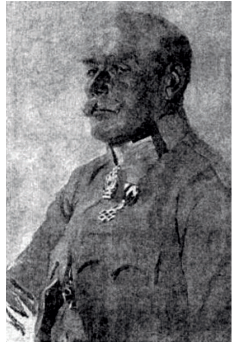
Feldmarschalleutnant Ludwig von Fabini*