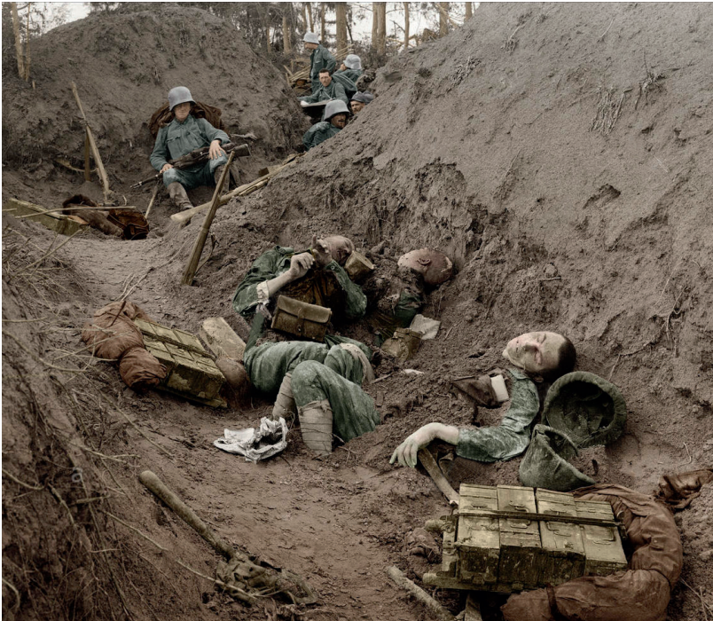
Gefallene Soldaten im Schützengraben