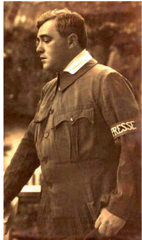
Franz Molnar als Kriegsberichterstatter