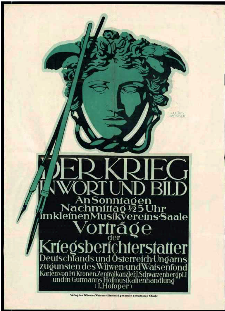
Plakat für einen Vortrag der Kriegsberichterstatter im Wiener Musikverein