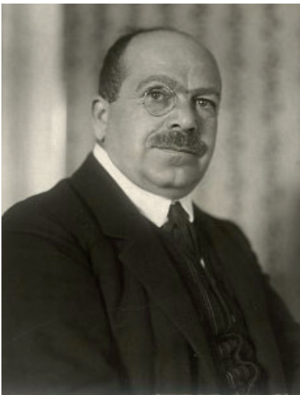
Der Schriftsteller Alexander Roda Roda*