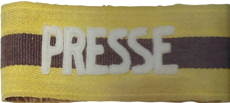
Armbinde für Kriegsberichterstatter an der Front