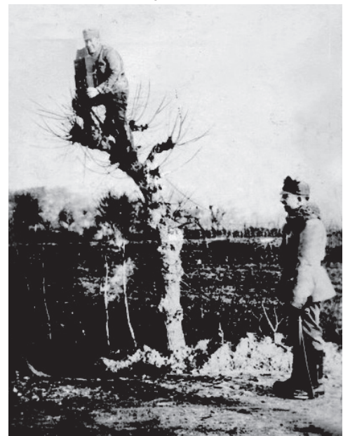
Kriegsberichterstatter mit Kamera auf einem Baum