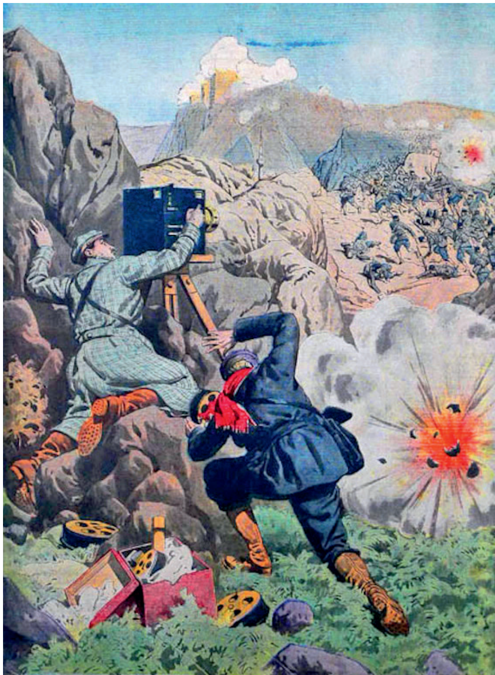
Zwei Kriegsberichterstatter: »Gotteswillen, was war das?« – »Ein kleinkalibriger Mörser älteren Systems.«