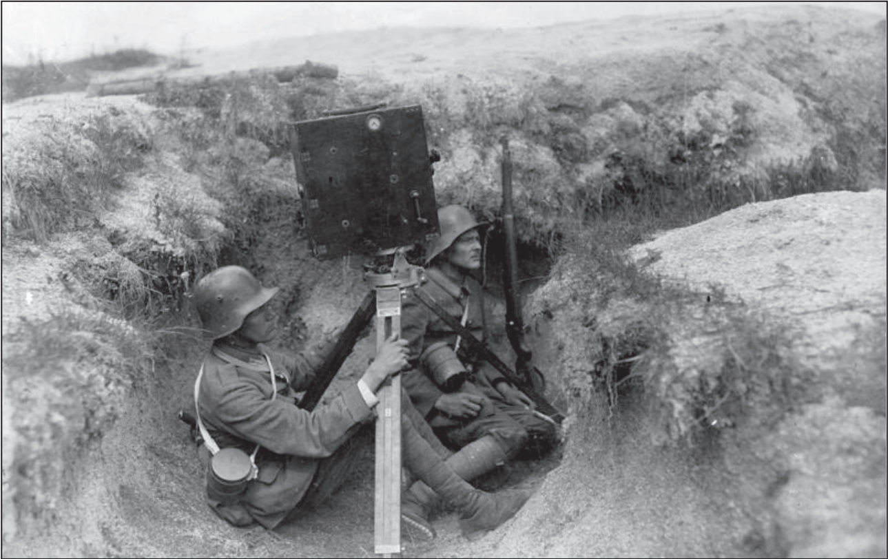
Westfront (1917): »Sie haben geschrieben, Sie wollen sich den Krieg an der Südwestfront ansehen. No also, sehn Sie sich ihn an, da haben Sie ihn!«