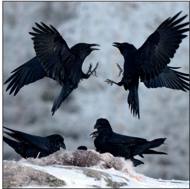
Raben – »Sie krächzen, als ob sie witterten die Beute!«