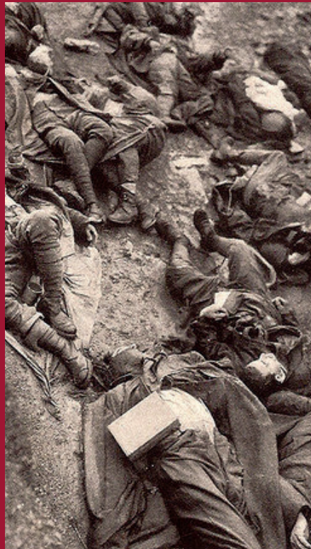
Tote in Hunger und Dreck