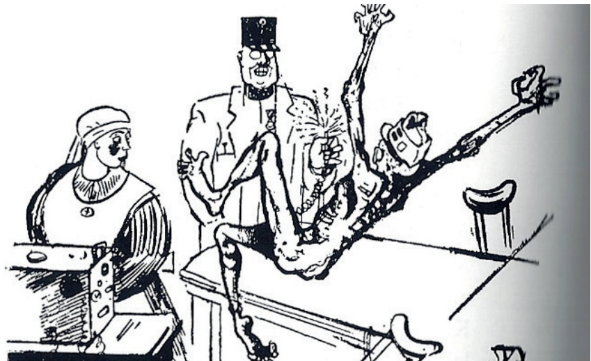
In der Behandlung der Zitterneurose lebten mittelalterliche Torturen auf

Die »Kaufmann-Kur« zählte zu den gängigsten Methoden zur Therapie von seelisch verwundeten Soldaten. Dabei handelte es sich um ein äußerst schmerzhaftes Verfahren, das Suggestion, militärischen Drill und elektrische Folter kombinierte. Die psychisch kranken Patienten wurden unter Anwendung des faradischen Pinsels elektrisiert. Zeigten die Stromschläge keine Wirkung, wurde die Schmerzzufuhr erhöht. Die elektrischen Schläge brachten die zu beobachtenden Schüttel- und Zittersymptome zum Verschwinden und zwangen den Patienten zur »Flucht in die Gesundheit«.